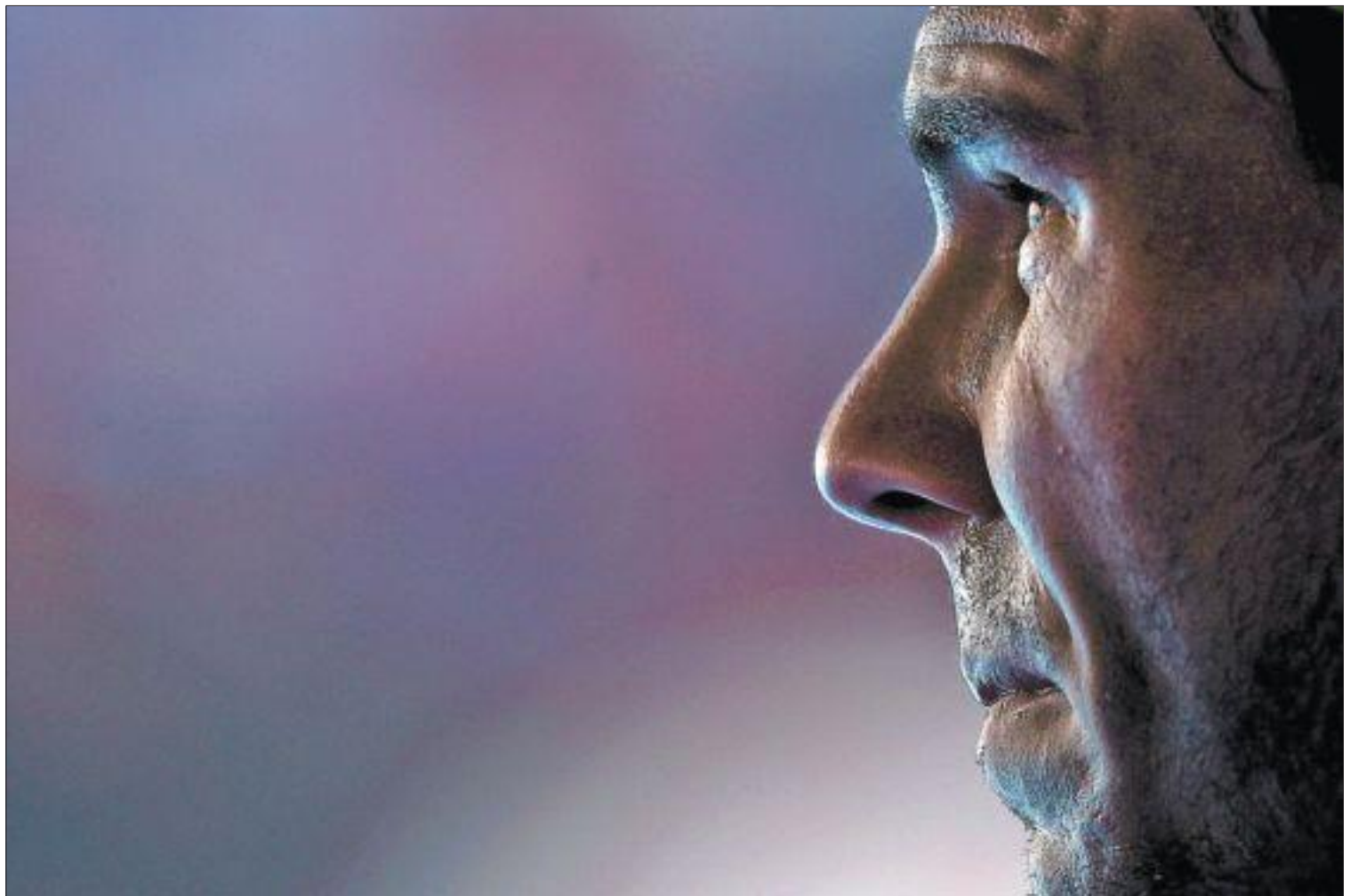
Rafa Nadal.

R. No noto ningún cambio. No me tengo en mejor consideración ahora que hace siete meses. Todo